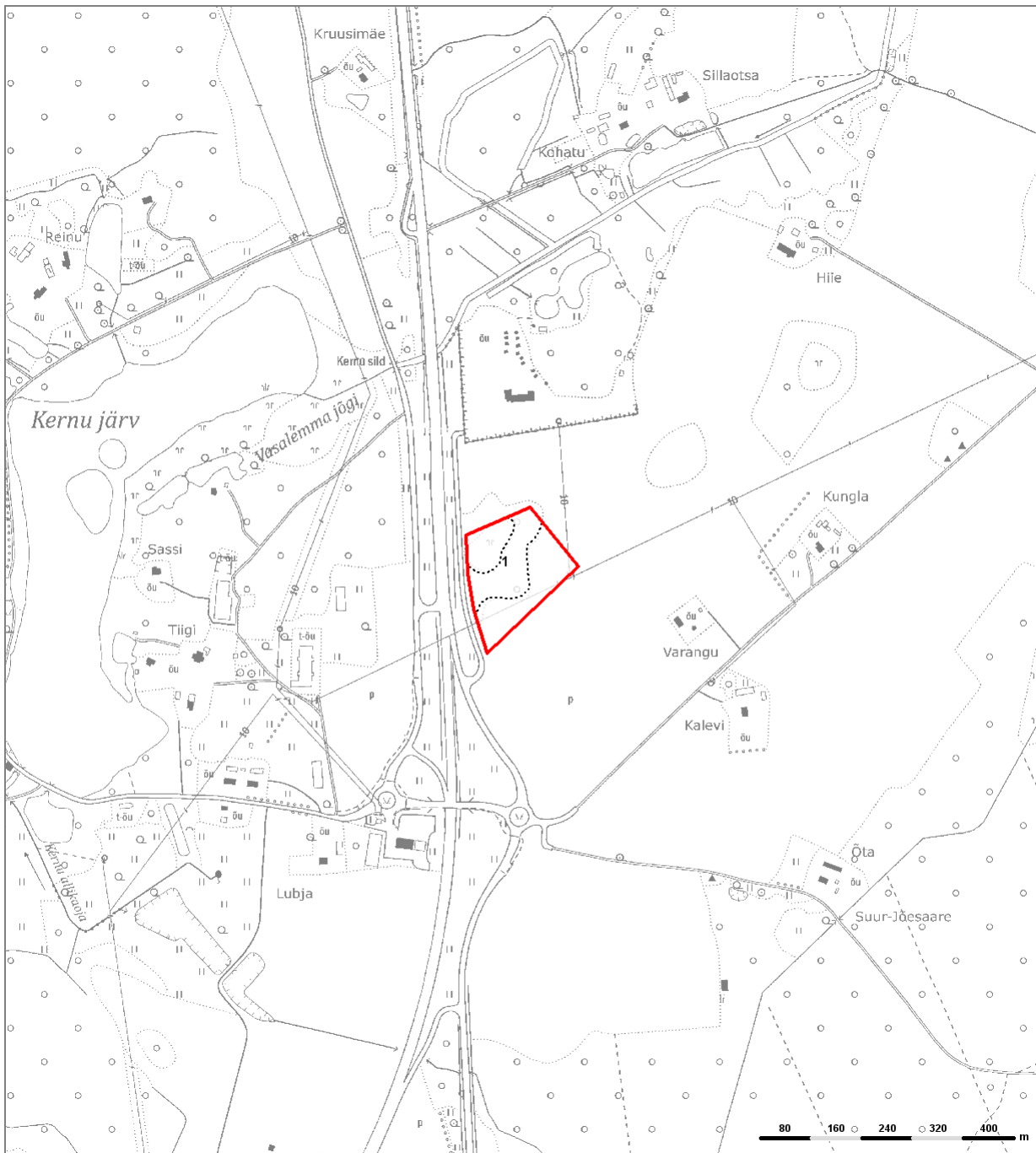
Aluskaart: Riigi Maa-amet